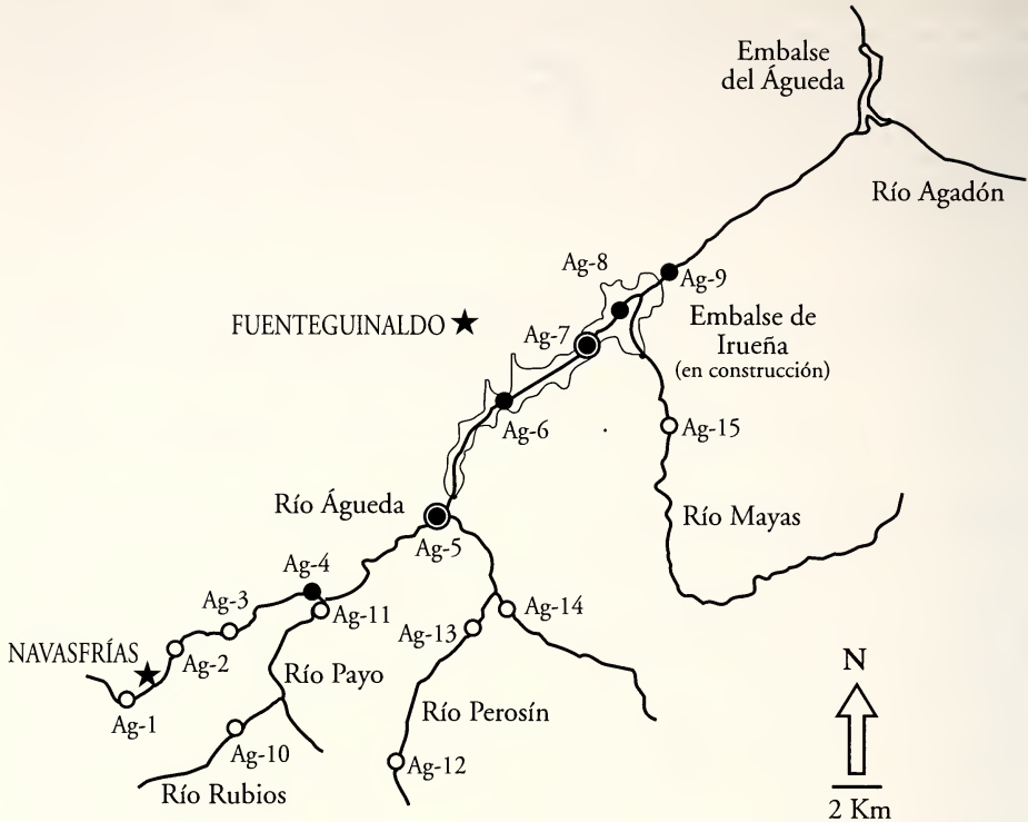
Figura 2. Mapa detallado del área de estudio señalando las localidades muestreadas: círculo blanco, para estaciones donde el muestreo fue negativo, círculo negro para estaciones donde han aparecido sólo conchas y doble círculo para las estaciones donde se han localizado ejemplares vivos.

Figure 2. Detailed map showing the study area and the localities sampled. White circles: no records. Black circles: presence of only shells. Double circles: living mussels.